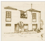
La casa amarilla en el Puerto de la Cruz.