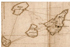
Método de la distancia entre las islas por Feuillée.

Feuillée, además de cartografiar las Islas occidentales, dibujar líneas de costa y planos de ciudades (como Valverde en El Hierro), no pudo sustraerse a intentar la ascensión al Teide, cuya altura calculó, aunque sin acierto. Por otra parte, durante su estancia, que se prolongó algo más de tres meses, se dedicó también a recoger diversas muestras botánicas y zoológicas, algunas de las cuales plasmó en dibujos, como el drago, la violeta del Teide, la orchilla, la barracuda o el perenquén. Por todo ello, Louis Feuillée es considerado el pionero de las exploraciones científicas en el Archipiélago.