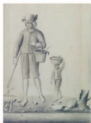
Pescadores de Tenerife por Feuillée.

En 1724 la Academia de Ciencias de París encomendó al astrónomo y religioso Louis Feuillée la realización de diversas observaciones científicas en Canarias, que se complementarían con otras efectuadas en París. Este experimentado viajero emprendió, nada menos que a los 64 años de edad, su última misión oficial, culminando así una dilatada y relevante trayectoria científica con la que sería la primera exploración de esta naturaleza que tuvo por destino específico el Archipiélago Canario.