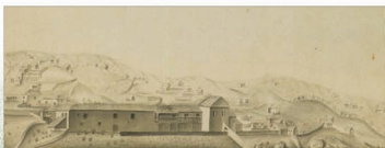
Vista de un pueblo de la isla de El Hierro por Feuillée.