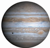
Trínito de lo sobre Jigiter, usado para la determinación del meridiano de El Hierro.